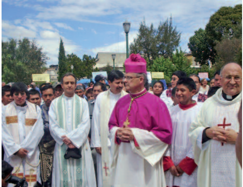
Monseñor Molina llega a la catedral

ta para el sábado 17 de septiembre. Los actos comenzaron a las nueve de la mañana en las calles de Quetzaltenango, por las que una nutrida multitud caminaba hacia la catedral acompañando a su nuevo pastor. Allí, en el templo catedralicio, le esperaba una enorme multitud de feligreses venidos de todas las parroquias de la Arquidiócesis, así como numerosos obispos de Guatemala, Costa Rica, El Salvador y Panamá.