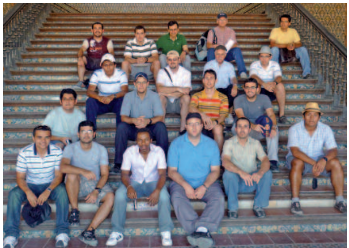
Los participantes en el Mes, durante una excursión

En concreto, procedían de seis países: Argentina, Brasil, Colombia, México, Perú y República Dominicana. Los únicos que no pudieron asistir, por dificultades burocráticas, fueron los jóvenes religiosos de Filipinas.