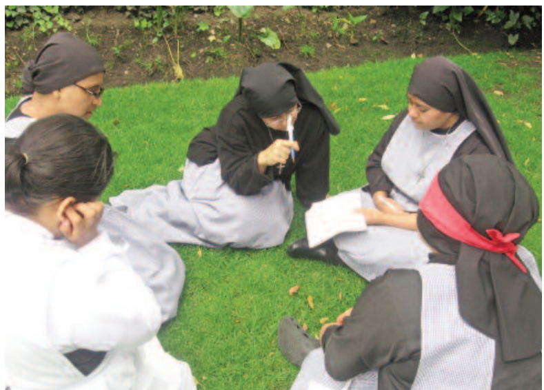
Un grupo de monjas, durante una de las dinámicas