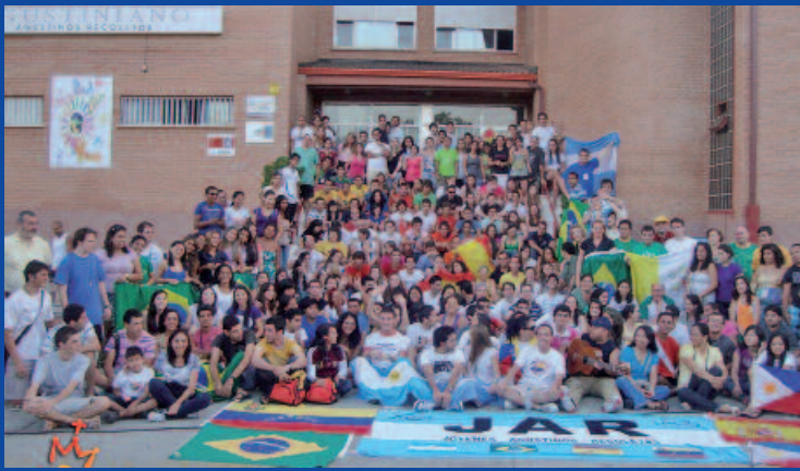
Foto de grupo, a la entrada del Colegio Agustiniano