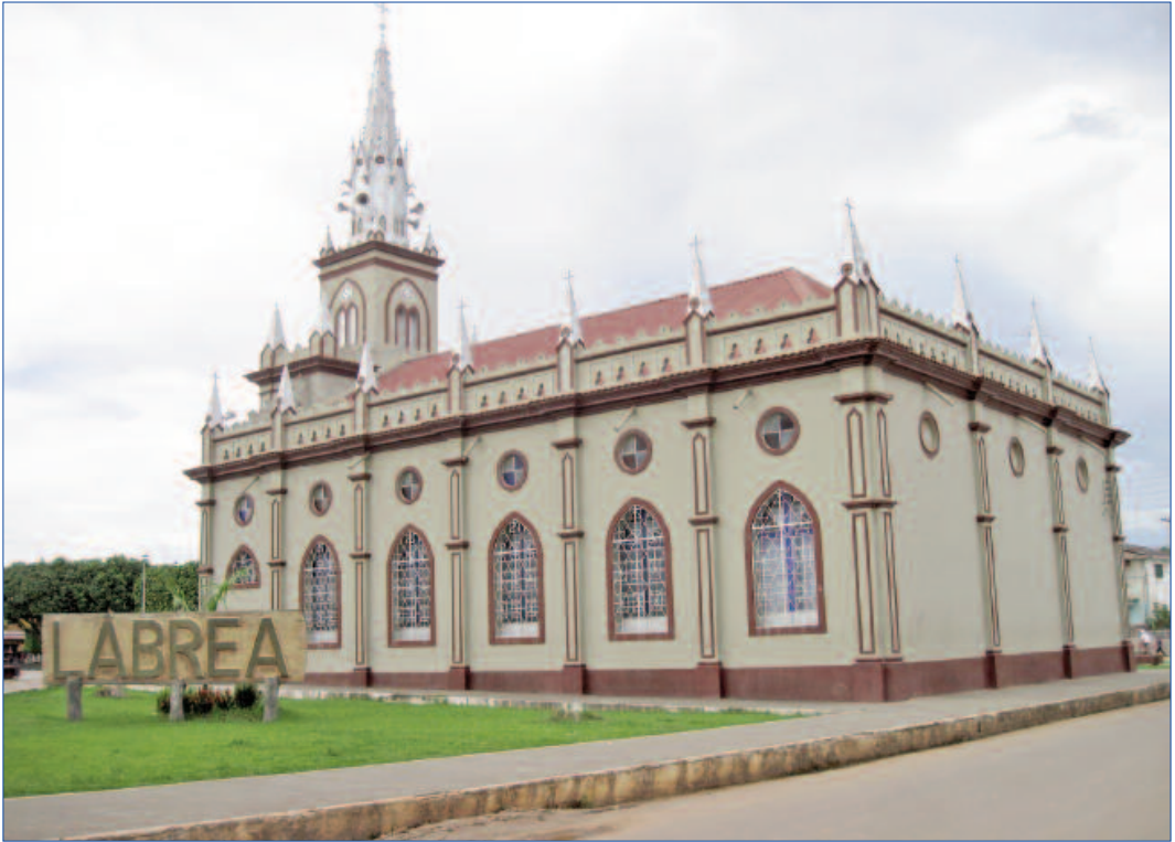
Catedral de Lábrea