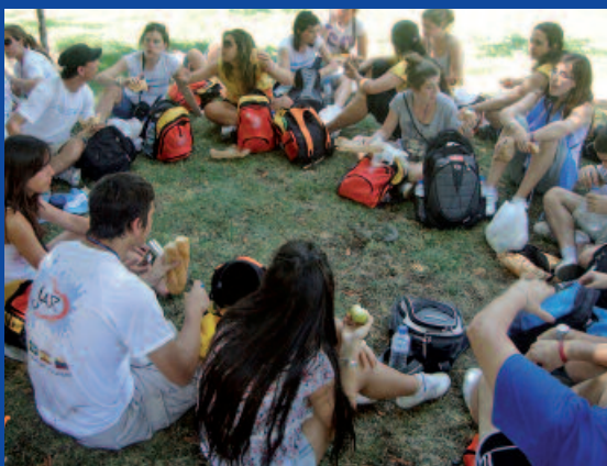
Hora de reponer fuerzas