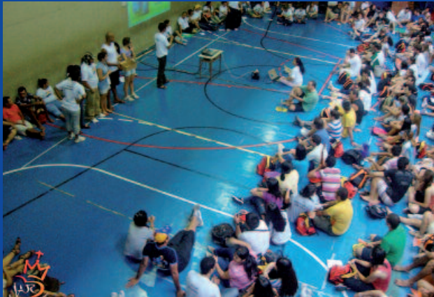
Organizando la jornada