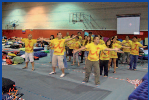
Intercambio de culturas