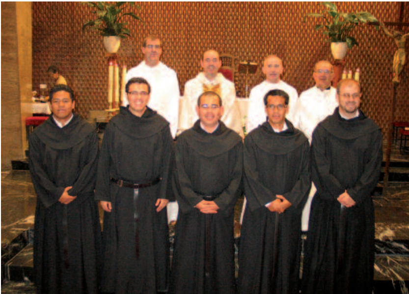
Los recién profesos. Detrás, sus formadores