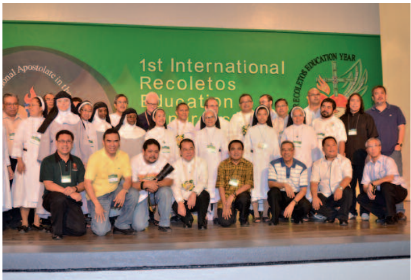
Agustinos recoletos asistentes al Congreso

Bajo el lema "Encendiendo corazones y disponiendo las mentes para el servicio", la provincia de San Ezequiel convocó un Congreso Internacional sobre Educación