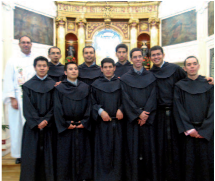
Grupo de profesos, con el maestro

Tuvieron lugar el día 6 de agosto. Profesaban 10 jóvenes procedentes de cinco países americanos (Brasil, Guatemala, México, Perú y Venezuela) y pertenecientes a las cuatro provincias con sede en España. Presidía el padre General, y con él concelebraban tres de los provinciales de España, más el vicario de San José, que representaba a su Provincial, recién elegido. También concelebraban más de cua-