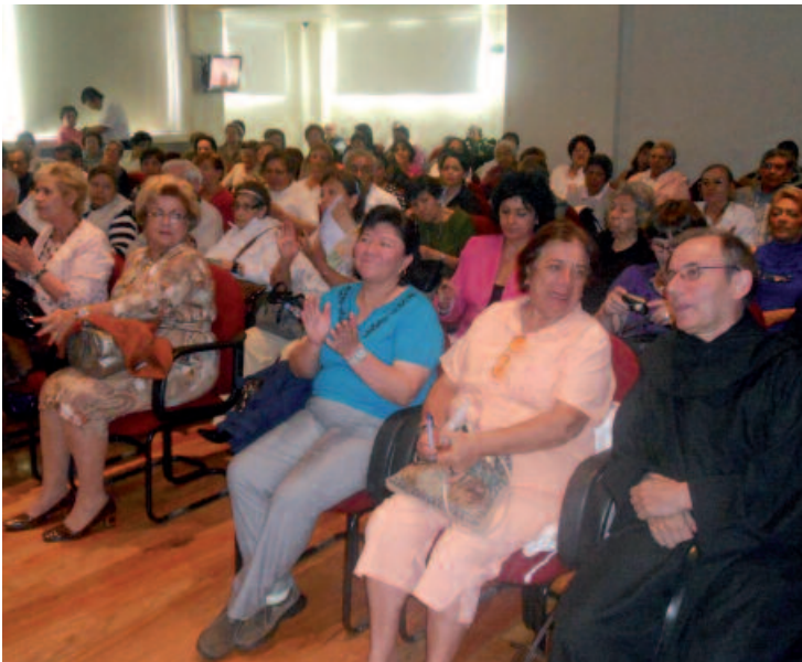
El padre General durante el acto

Los 300 asistentes a este encuentro escucharon en las instalaciones del Centro de Acompañamiento y Recuperación de Desarrollo Integral (CARDI) los planes de futuro de la Orden, que se resumen – según el padre General – en el proceso de revitalización y reestructuración.