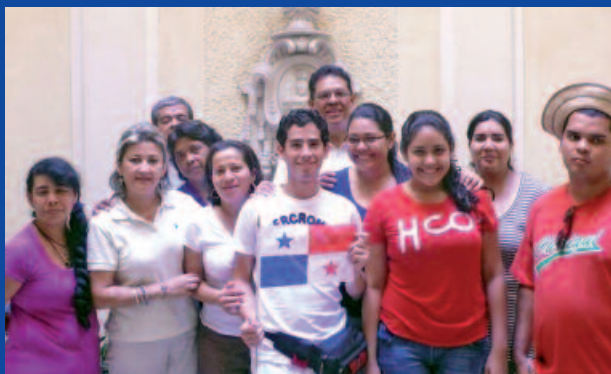
El grupo de David (Panamá), en Roma