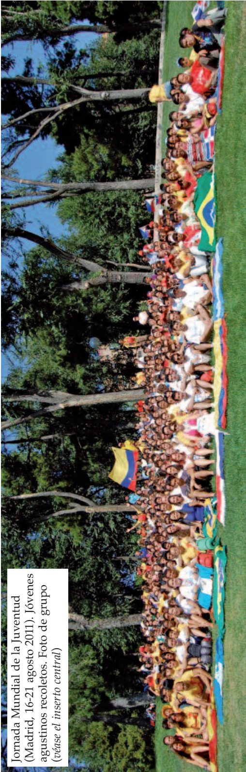
Jornada Mundial de la Juventud (Madrid, 16-21 agosto 2011). Jóvenes agustinos recoletos. Foto de grupo (véase el inserto central)